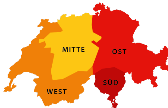
Die 4 Sektionen des VBSF