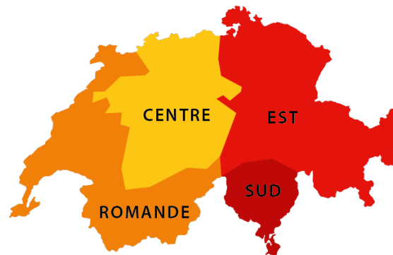
Les 4 sections de la SSPS