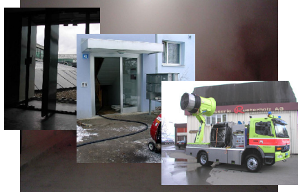
Stadt Zürich Schulz & Hurling