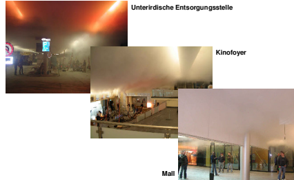
Stadt Zürich Schulz & Wehrung