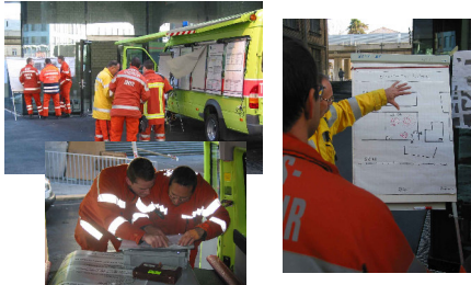
Stadt Zürich Schulz & Wehrung