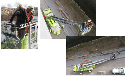
Stadt Zürich Schulz & Wehrung