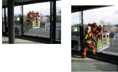
Stadt Zürich Schulz & Wehrung