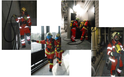
Stadt Zürich Schulz & Hurling