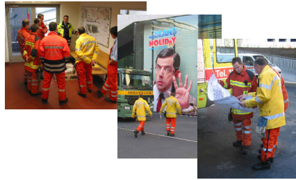
Stadt Zürich Schulz & Wehrung